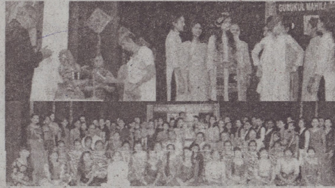
પોરબંદરની આર્થિક ગુરુકુળ મહિલા કોલેજમાં ગુરુપૂર્ણિમા અને નવી વિદ્યાર્થીનીઓનો સાંસ્કૃતિક કાર્યક્રમ યોજાયો ત્યારની તસ્વીર.

રાજસ્થાન શ્રેષ્ઠી નાનજીભાઈ કાલિદાસ મહેતા ટ્રસ્ટ સંચાલિત ગુરુકુળ મહિલા આર્ટ્સ એન્ડ કોમર્સ કોલેજમાં ગુરુપૂર્ણિમાના પાવન પર્વે ગુરુવંદના-ભાવપૂર્ણ કાર્યક્રમ અને 'ન્યુકમર્સ ટેલેન્ટ મોર્નિંગ' કાર્યક્રમની ઉજવણી ખૂબ ઉત્સાહપૂર્વક કરવામાં આવી. નવી આવેલ વિદ્યાર્થીનીઓમાં રહેલી પ્રતિભાને બહુભર લાવવા અને તેમને આવકારવા આ કાર્યક્રમનું આયોજન કોલેજમાં ચાલતી ગીત-સંગીત નૃત્યધારા અંતર્ગત કરવામાં આવેલું.