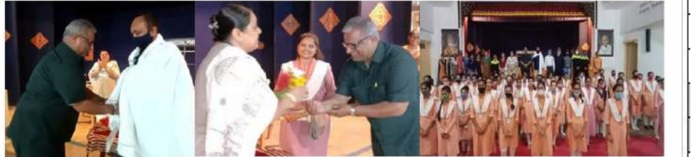
પોરબંદરની ગુરુકુળ મહિલા કોલેજમાં ગુરુવંદના કાર્યક્રમ યોજાયો તસ્વીર