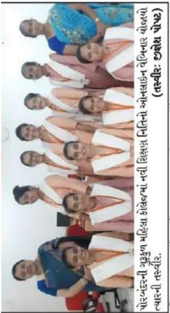
પોરબંદરની ગુરુકુળ મહિલા કોલેજમાં નવી શિક્ષણ નિતિનો આનંદવાહન વેબિનાર યોજાયો