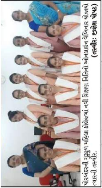
પોરબંદરની ગુરુકુળ મહિલા કોલેજમાં નવી શિક્ષણ નિતિનો આનંદવાહન વેબિનાર યોજાયો