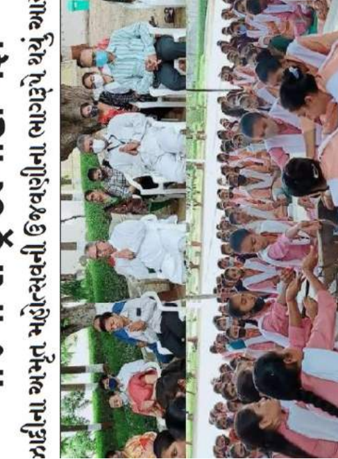
શ્રી-સોમના ગુરુન યજ્ઞ