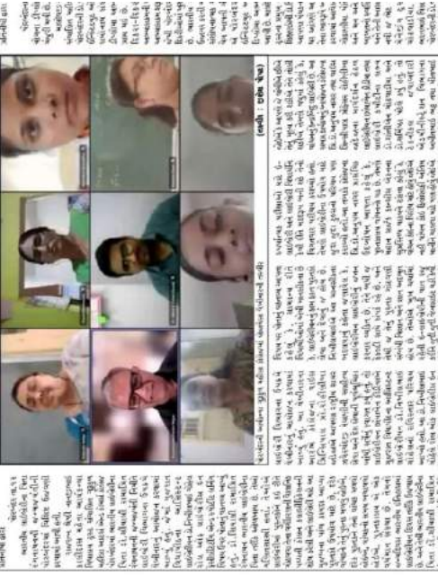
આઈવનના ગુરુકુળ મહિલા કોલેજમાં વિદ્યાર્થીઓને સપાયું માર્ગદર્શન : ઇ લાઇબ્રેરીનો ઉદ્ધેશ્ય કયા પણ ટીપ્પા અપાઈ