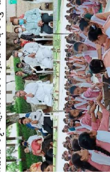
પ્રાદેશના અમૃત મહોત્સવની ઉજવણીના ભાગરૂપે થયું આયોજન