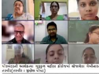
પોરબંદરની આઈકલવા ગુરુકુળ મહિલા કોલેજમાં યોજાયેલા વેબીનારની તસ્વીર