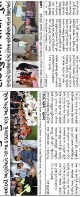
નવરાત્રી અવસરને પરવા કરવાસા પુસ્ત્ર આલંબ થયો