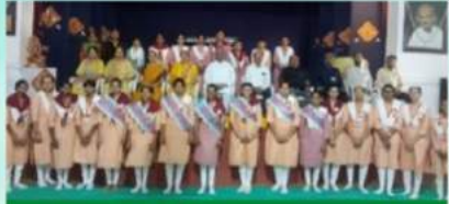
વિદ્યાર્થીઓમાં નેતૃત્વકલાના ગુણો વિકસાવવાના આશયથી આયોજન કરાયું