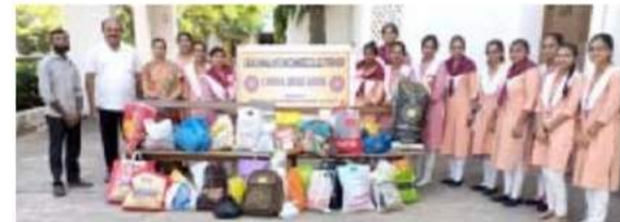
પોરબંદરની ગુરુકુળ મહીલા કોલેજમાં દિવાળી પર્વ પહેલા જુદી જુદી ચીજવસ્તુઓ જરૂરીયાતમંદ બાળકોને આપવા માટે એકત્ર કરવામાં આવી હતી. તેની તસ્વીર

લ પ્રતિનિધિ-પોરબંદર રની ગુરુકુળ મહીલા કોલેજમાં પર્વ પહેલા જુદી જુદી ની જરૂરીયાતમંદ બાળકોને ઓક્ર કરવામાં આવી હતી. આ મહીલા કોલેજના સ દારા માહી ગૃપ એક સેવાયજ્ઞમાં સયવારી પુરાવ્યો ફેર યુ ના એન.એસ.ના સૂત્રને આ જ ગુરુકુળ મહીલા કોલેજના અમલમાં મુકી એક એવા તી આપી હતી. પોરબંદરની સ્થા માહી ગૃપ દ્વારા સમાજમાં યાત વાળા પરીવારો છે. જેમને ને સામાજિક સમસ્યાઓથી સાથો પ્રકાશના આ પર્વ અંકારમય અનુભવ અને