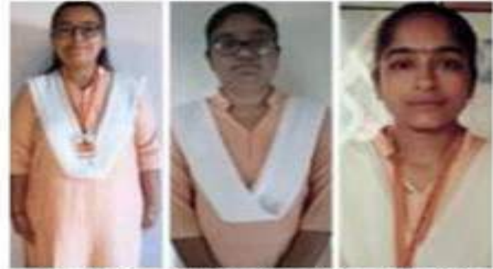
નુરુલ મહીલા કોલેજના કોમર્સ વિભાગ સેમ-૨નું પરિણામ જાહેર કરતાં ડીપ-૩ વિદ્યાર્થીનીઓની તસ્વીર

કોલેજમાં તા.૧૪.૧૨.૨૦ સેશી તા.૧૫.૧૨.૨૦ના દિવસે મહીલા જાતની કોમર્સ શાખાનીઓએ પ્રથમ મેડલનું વર્ષમાં પણ શાખાનીઓએ પ્રથમ કોલેજનું ડિપ્લોમા મેળવ્યું છે. સરકારના