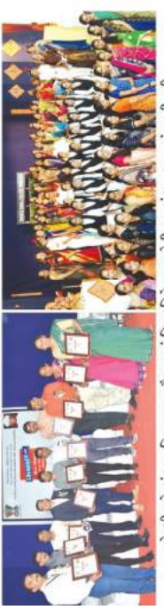
મોરબી, પોરબંદર સહિત સમગ્ર સોરઠાપટ્ટમાં શિક્ષકદિને ગુરૂજનોની ભાવદંભા કરવામાં આવી હતી.

ભારતની શ્રેષ્ઠ એવી યુનિયન પબ્લીક સર્વિસ કમિશનની વિવિધ પરીક્ષાઓ સ્માર્ટ વર્ક દ્વારા પાસ કરી શકે તે પોરબંદરની ગુરૂકૃષ્ણ મહિલા કોલેજના ઉદીશા અને ડેરોઈઅર કાઉન્સેલિંગ સેલ દ્વારા એક ઓનલાઈન વેબીનારનું આયોજન કરવામાં આવેલું. જેમાં ન્યુ ટિલ્લી સિટિ કરવામાં દ્વારા યુપીએસસીની પરીક્ષાઓ કંઈ રીતે સહજતાપૂર્વક પાસ કરી શકાય તેની માહિતી આપવામાં આવેલી. સેશનની શરૂઆતમાં કંઈ રીતે વિદ્યાર્થી અવસ્થામાં ડ્રીમ જોવું અને એ ડ્રીમ સાંબંધ કરવા આયોજનબંધ બની કેમ મહેનત કરવી જેની પ્રેરણા આપવામાં આવેલી. સિવિલ સર્વિસની પરીક્ષા અને તે પાસ થયા બાદ શરૂ થનારી એક ગ્રેલેન્જ સાથેની ઉપર ભાર મુક્યો હતો.