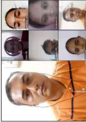
પોરબંદરની અર્થિક્થ્યા ગુરુકુળ મહિલા કોલેજમાં કોરોના વેક્સીનેશનની વેગીનાર યોજાયો.

નું રસીકરણ કરાવવું કે નહીં કિંચિત્ અસંભવિય યોગ્યમાં હોય છે ત્યારે પોરબંદરમાં કુરુકુળ મહિલા કોલેજ દ્વારા 'વેગીનાર' યોજાયો છે. કોરોના મહામાર્ગી અકાત ના અગ્રણી રહી છે ત્યારે જ પ્રશ્નભર પુસ્તક થઈ સંબંધોમાં સરકાર અને દ્વારા પણ વેક્સીન પુસ્તક વે તવા સવન પ્રવચનો થઈ હાર ગરૂપીય સેવા યોજના પ્રક્રિયા સેવા ધરાવે ગુરુકુળ જી. પોરબંદર દ્વારા પણ ના ઉચ્ચવેળ વાલસ સંબંધોમાં વેક્સીન અને કોલેજની વિદ્યાર્થીનીઓને સમાવવાં વધુને વધુ લોકો થયે છે અનુરૂપતાને ઓ વેગીનાર વેક્સીનેશન સેવા અનુભવ યોજવામાં જમાં જામનગરની તાલ સરકારી પોડીય ના સ્વચ્છતા પ્રક્રિયકર ડો વેક્સીન (એમ.ડી.ઈન ડી) તરફના તરફી સેવા સંબંધમાં ઓ પીકલ દ્વારા મહિલા કોલેજના અધિકારીઓને કોલેજના વીડીયોમાં માટે કરવામાં નેક પ્રકારે પણ કોલેજની વિદ્યાર્થીનીઓને પ્રક્રિયકર ન લઈ લે તે માટે યથા