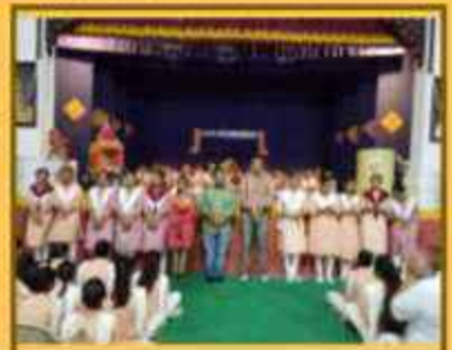
પંચામૃત (કોર્પોરેટિવ ચેન્જ યુવ આઈડિયીય પ્રોગ્રામ)

"લક્ષ્મી અઢળક સંપાદન કરતા હતા, છતાં તેમનામાં નહોતો લક્ષ્મીનો મદ. નહોતું તેમનામાં અતડાપણું કે નહોતું તોછડાપણું, રાગદ્વેષરહિત જીવન તેમણે જીવી જાણ્યું. જ્ઞાનથી નિર્મળ થયેલા ભાવનાશાળી આત્મવાન એ હતા એક કર્મવીર અને વળી દાનવીર. જ્ઞાન, કર્મ અને દાનના ફળ રૂપે પરિપક્વ જીવનદશામાં એ થયા સાચા મુક્તિવીર"