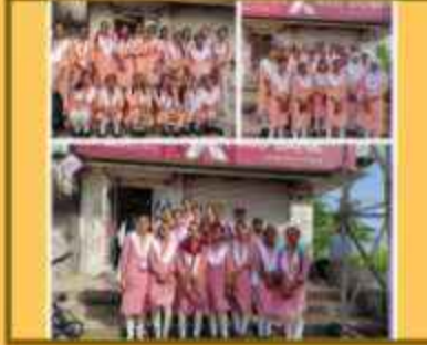
બી.કોમ. અંગ્રેજી માધ્યમની વિદ્યાર્થીનિઓની એક્સિસનન્ટની મુલાકાત