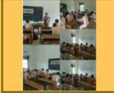
નિર્માણ લેખન (હિન્દી સપ્તાહ)