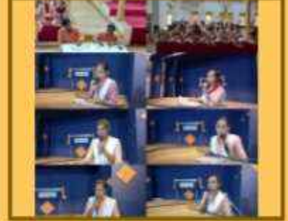
કાવ્ય પઠન સ્પર્ધા (હિન્દી સપ્તાહ)