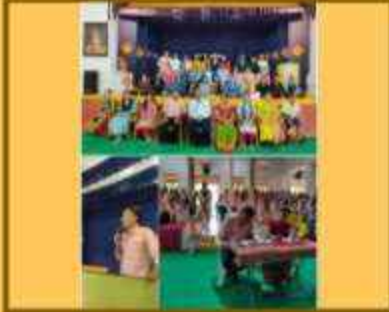
પ્રવૃત્તિ- નાટક સ્પર્ધા વિષય - કોમર્સ