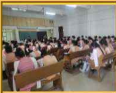
ઈનોવેટીવ આઈડિયા ફોર કોર્પોરેટિવ ચેન્જ કોમ્પીટીશન