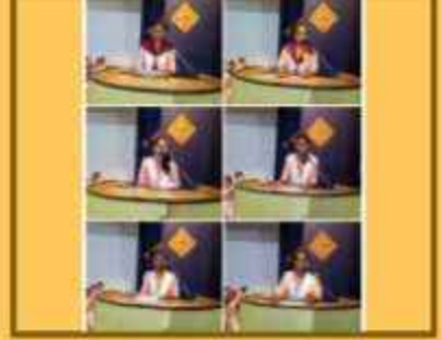
પ્રેમચંદ કવન પ્રસ્તુતિ (પ્રેમચંદ જન્મજયંતિ સંદર્ભે)