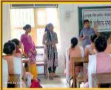
ગૃપ ચર્ચા વિષય :- રાજશાહી લોકનંત્ર કે લોકશાહી લોકનંત્ર ?