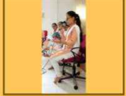
ડિજિટલ રેકોર્ડિંગ ફોર રેડિયો ટેલીકાસ્ટ