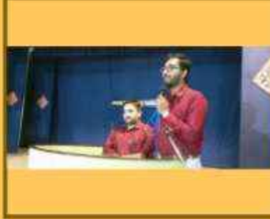
વિશ્વ સંસ્કૃત સપ્તાહ