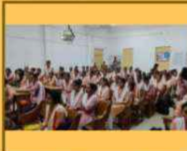
વેબિનાર 'ઈન્ટેલેક્ટ્યુઅલ પ્રોપર્ટી રાઈટ'