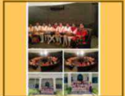
ભારતમંદિર & તારામંદિર ટર્ચન

'રાજકારણમાં મારું કામ નથી'-'ત્યાં જવાથી કાંઈ વિશેષ સેવા કરી શકું એવું મને નથી લાગતું'