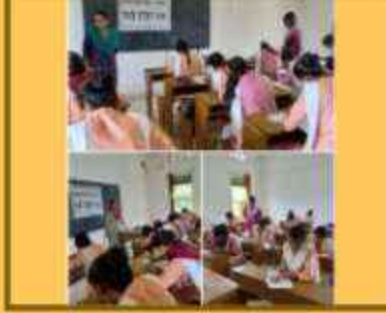
અનુવાદ લેખન સ્પર્ધા