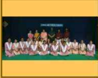
વિશ્વ સંસ્કૃત સપ્તાહ