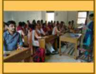
કિવજ સ્પર્ધા (પ્રેમચંદ જન્મજયંતિ સંદર્ભે)