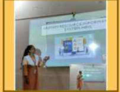
બી.કોમ. ક્લાસિકમ પ્રેઝન્ટેશન