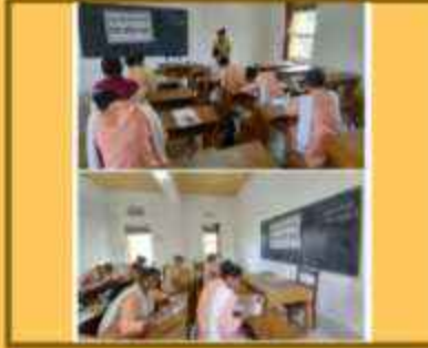
નિબંધ લેખન સ્પર્ધા (પ્રેમચંદ જન્મજયંતિ સંદર્ભે)