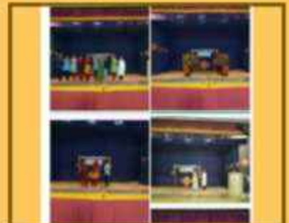
હિન્દી સપ્તાહ સમાપન કાર્યક્રમ & નાટક, ડાન્સ અને ઈનામ વિતરણ.