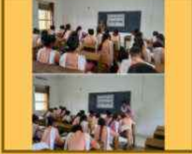
અનુવાદ લેખન પરિચય