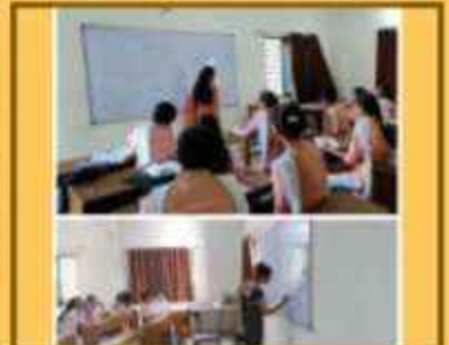
ટીચર્સ ડે સેલિબ્રેશન

"તેમનું ભણતર હતું ગુજરાતી. અનુભવે થોડું અંગ્રેજી સમજતા. સંસ્કારી અને હુન્નર સંબંધી જ્ઞાન તેમની દુનિયાની મુસાફરીઓમાંથી અને અનેક મુલાકાતોથી પ્રાપ્ત કરેલું. વિદ્યાને તેઓ અગ્રગણ્ય સ્થાન આપતા. તેની વૃદ્ધિને માટે જરૂરી દાન અચૂક કરતા. સાહિત્યકારો, કવિઓ, ધર્મોપદેશકો, વિદ્વાનો અને રાજદ્રાવીઓ માટે તેમનો સંપૂર્ણ સહકાર હતો. (પૃ.૧૨૧, શ્રી ટી. જી. ઈનામદાર, સ્મૃતિ અને સંસ્કૃતિ.)