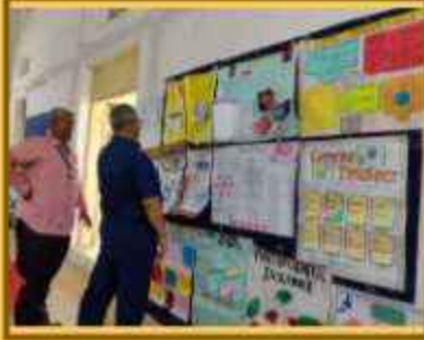
ચાર્ટ મેકિંગ કોમ્પિટિશન ઓન ફાઈનાન્સિયલ ટોપિક્સ