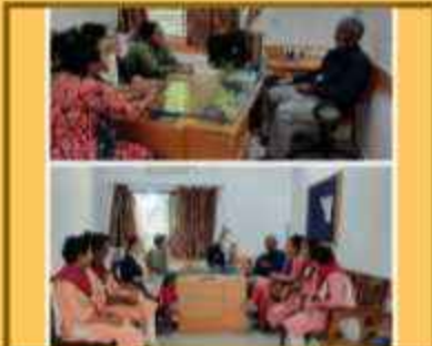
ઈમેમસી સ્ટાફ તથા સીઆર મિટિંગ