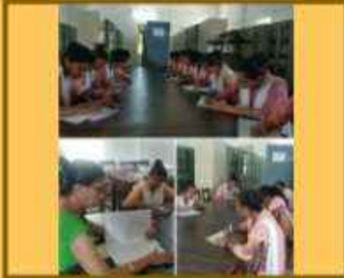
સાહિત્યિક ગેમ (હિન્દી સપ્તાહ)