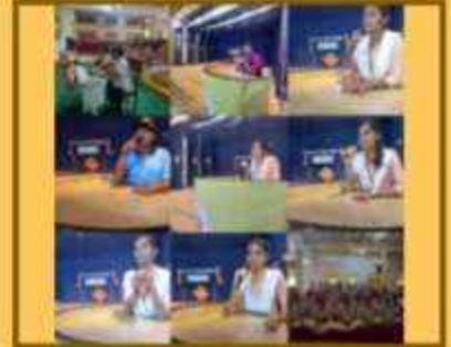
શીક્ર પઠન સ્પર્ધા (હિન્દી સપ્તાહ)