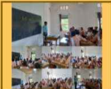
અંતરાલરી સ્પર્ધા (હિન્દી સપ્તાહ)