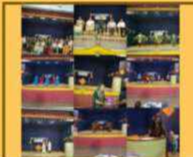
હિન્દી સપ્તાહ સમાપન કાર્યક્રમ