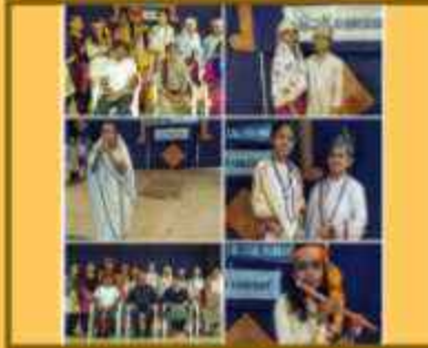
વેશભૂષા સ્પર્ધા (હિન્દી સપ્તાહ)