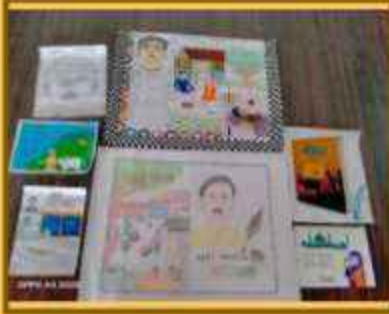
ચિત્ર સ્પર્ધા (પ્રેમચંદ જન્મજયંતિ સંદર્ભે)