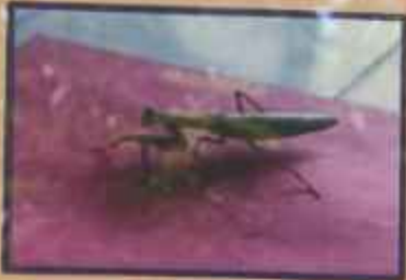
પરભક્ષી ખડમાંકડી (મેન્ટીડ)

પરભક્ષી કીટકો જેવા કે ટાળીયા, લીલી કુટકી વગેરેના પુખ્ત કીટકોને ખોરાક તથા રહેઠાણ મળી રહે તે માટે મગ, મકાઈ કે તુવારની અન્વ પાક વચ્ચે અમુક ફાર કે ખેતર ફરતી બે ફાર વાવવી.