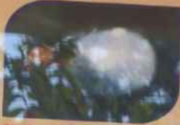
ઈંડાની પરજીવી (દાવાકોસામા ભયરો)