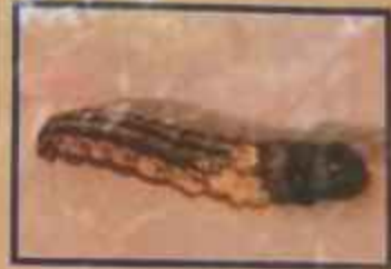
ઈંડાની પરજીવી - ડેબોન બેવીકીટકીક

પરભક્ષી કીટકો જેવા કે ટાળીયા, લીલી કુટકી વગેરેના પુખ્ત કીટકોને ખોરાક તથા રહેઠાણ મળી રહે તે માટે મગ, મકાઈ કે તુવારની અન્વ પાક વચ્ચે અમુક ફાર કે ખેતર ફરતી બે ફાર વાવવી.