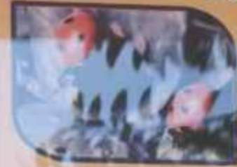
સફીલ્ટ બીલ (પાલોમા)

ઉપયોગી કીટકોના કાર્યક્રમ માંથી આપણે પેલુનાં પાક દવાનો ઉદ્દેશ્ય મુલાકાતી રાખવો અથવા તેના માટે બેન્ટો સલ્ફોન, ફોસ્ફોર જેવી સલામત દવાનો ઉપયોગ કરવો.