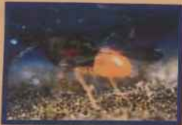
સરદેદ માખીની પરજીવી

શેરડીના ભંજિકાવાળી જીવાતના પરભક્ષી કીટક કાચલોકીરસ (કાળા ટાડીયા)ને કાપણી કરેલ ખેતરમાંથી એકઠા કરી નવા વાયેતર વાળા ખેતરમાં છોડો અથવા તો પતરીને સળગાવો નહિ અને ખેતરની આજુબાજુ વડલાના ઝાડ ઉગાડો.