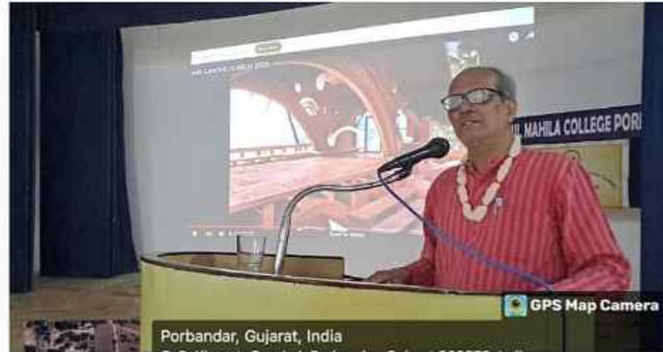
GPS Map Camera Porbandar, Gujarat, India