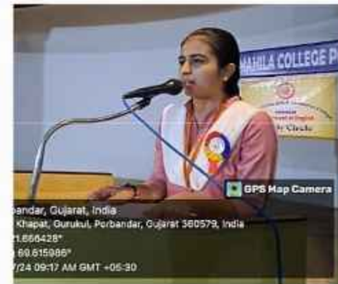
GPS Map Camera Porbandar, Gujarat, India Q-9, Khapat, Gurukul, Porbandar, Gujarat 360579, India Lat 21.656428° Long 69.615986° 11/07/24 09:17 AM GMT +05:30