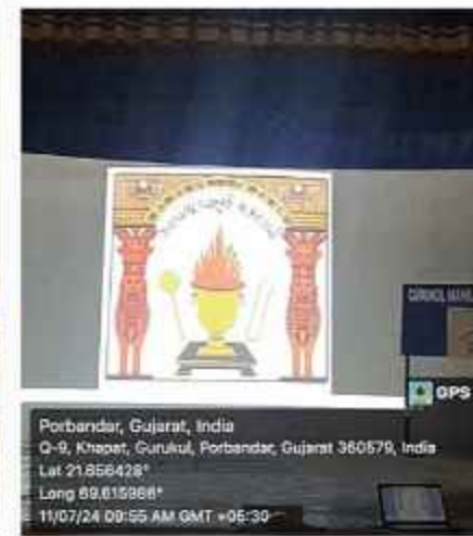
GPS Map Camera Porbandar, Gujarat, India Q-9, Khapat, Gurukul, Porbandar, Gujarat 360579, India Lat 21.656428° Long 69.615986° 11/07/24 09:55 AM GMT +05:30