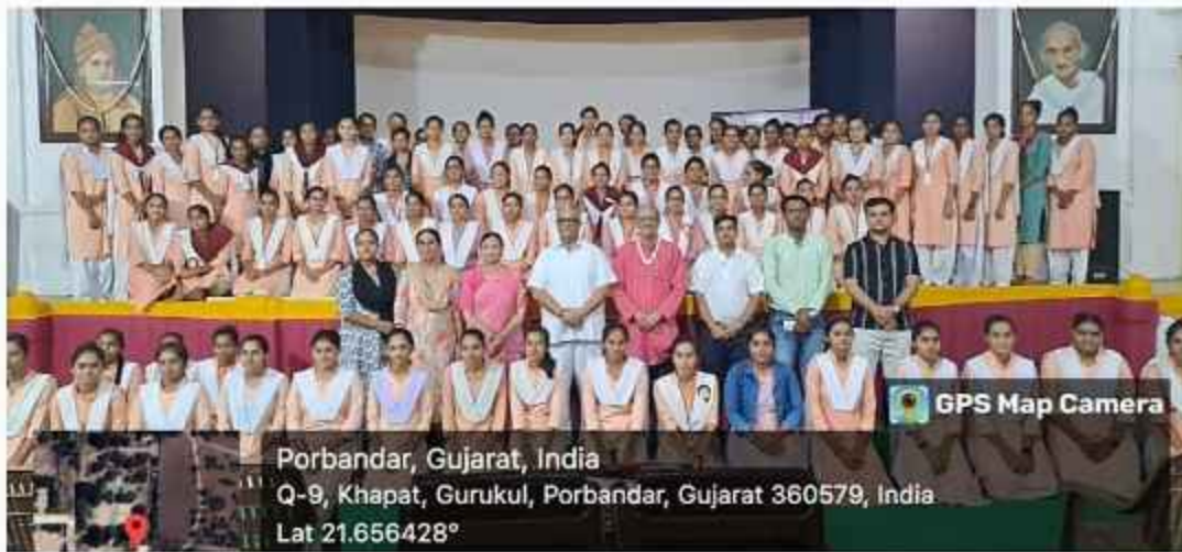
GPS Map Camera Porbandar, Gujarat, India Q-9, Khapat, Gurukul, Porbandar, Gujarat 360579, India Lat 21.656428°