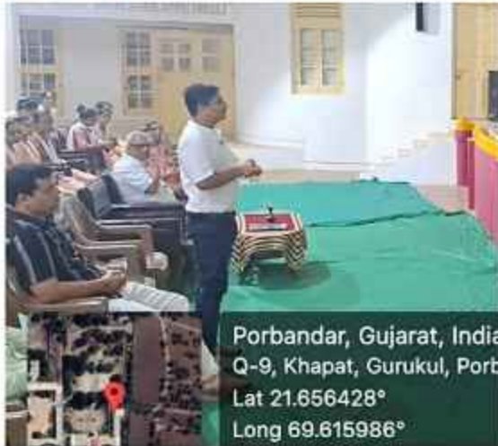
GPS Map Camera Porbandar, Gujarat, India Q-9, Khapat, Gurukul, Porbandar, Gujarat 360579, India Lat 21.656428° Long 69.615986°